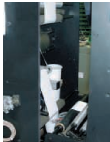
Schneidstation der Maschine, wo der Randbeschitt anfällt

Der Radialventilator ist zur Eindämmung von Schallemissionen mit einer Schallschutzhaube versehen und erzeugt den Treibluftvolumenstrom mit der erforderlichen Druckerhöhung. Die Treibluftleitung verbindet den Druckstutzen des Ventilators mit dem